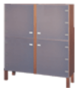
Szafa Q3 140 x 42 x 160H